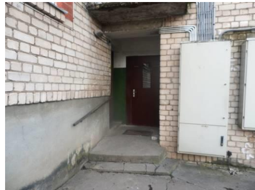
Ieeja kāpņu telpā