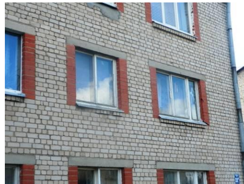
Dzīvokļa Nr.11 logi