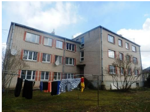
Dzīvojamā māja Vienības ielā 32V