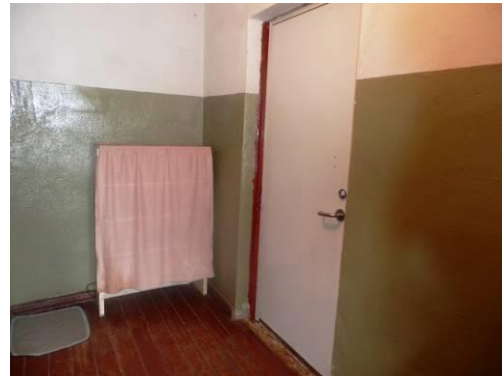
Dzīvokļa Nr.11 ieejas durvis