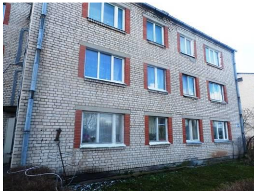
Dzīvojamā māja Vienības ielā 32V